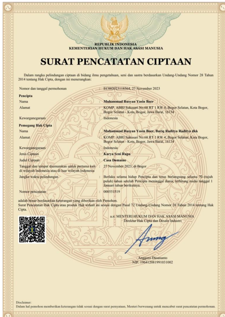
Gambar 3. Bukti Surat Pendaftaran Ciptaan Muhammad Rusyan

Bukti telah berhasil dilakukannya pendaftaran Hak Cipta dapat dilihat pada Gambar berikut: