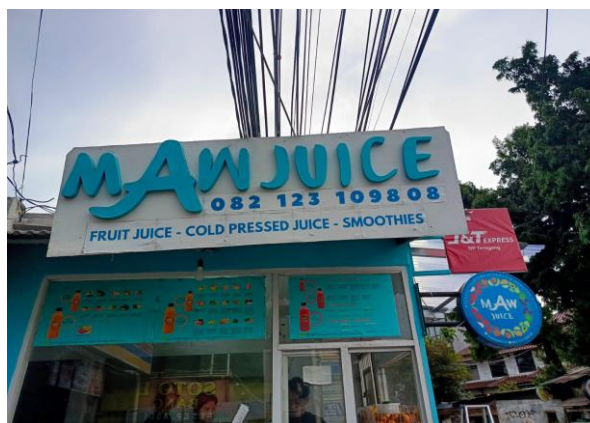
Gambar 1 UMKM yang Bersedia didampingi mendaftarkan Merek

Pada tanggal 1 Desember tim pengabdian melakukan wawancara kepada pemilik UMKM tersebut untuk mengetahui berbagai permasalahan yang ada dalam mendaftarkan merek dengan hasil sebagai berikut :