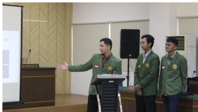
Gambar 6 Dialog Tanya Jawab