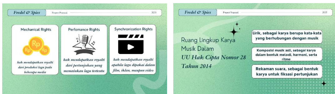
Gambar 7 Materi tentang Perlindungan Hak Cipta Lagu dan Ruang Lingkup Karya Musik

Hak cipta lagu melindungi pencipta melalui hak eksklusif, seperti Mechanical Rights (royalti dari reproduksi lagu), Performance Rights (royalti dari pertunjukan lagu), dan Synchronization Rights (royalti saat lagu digunakan dalam media seperti film atau iklan). Menurut UU Hak Cipta No. 28 Tahun 2014, perlindungan karya musik meliputi lirik, komposisi musik (melodi, harmoni, ritme), dan rekaman suara. Hak ini menjaga integritas karya dan memastikan pencipta mendapat perlindungan hukum.