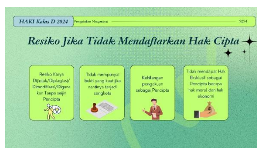
Gambar 6 Materi tentang Risiko jika Tidak Mendaftarkan Hak Cipta

Hak moral adalah hak yang melindungi pencipta terkait pengakuan dan integritas karyanya. Hak ini mencakup kebebasan untuk mencantumkan nama, menolak atau menyetujui penggunaan karya, serta melindungi karya dari perubahan yang merugikan reputasi pencipta. Pencipta juga dapat mengubah karyanya sesuai norma yang berlaku. Hak ekonomi, di sisi lain, memberikan pencipta hak eksklusif untuk memperoleh manfaat finansial dari karyanya, seperti melalui reproduksi, publikasi, adaptasi, atau lisensi. Setiap penggunaan karya, seperti lagu atau musik, harus disertai pembayaran royalti kepada pencipta. Tanpa pendaftaran resmi, pencipta tidak berhak menerima royalti, dan penggunaan karya tanpa izin dianggap sebagai pelanggaran hukum.