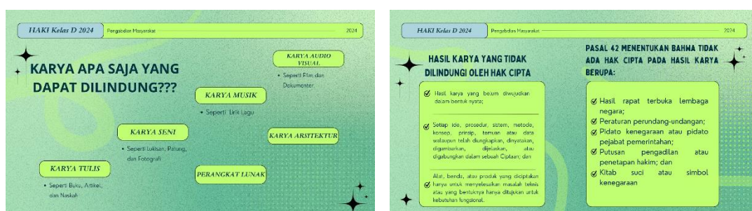
Gambar 3 Materi tentang karya yang dilindungi dan karya yang tidak dilindungi oleh Hak Cipta

Karya yang dilindungi oleh Hak Cipta meliputi berbagai hasil kreasi intelektual yang telah diwujudkan dalam bentuk nyata. Di antaranya adalah karya tulis seperti buku, artikel, dan naskah; karya seni seperti lukisan, patung, dan fotografi; karya musik dan lirik lagu; karya audio-visual seperti