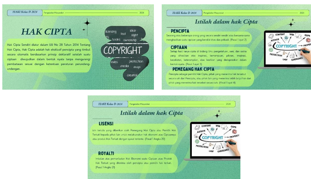
Gambar 2 Materi tentang Pengertian, Dasar Hukum, dan Istilah dalam Hak Cipta

Pentingnya Edukasi dan Informasi yang Komprehensif untuk meningkatkan pengetahuan dan kesadaran tentang perlindungan hak cipta, penting untuk memahami elemen dasar yang terkait dengan hak cipta itu sendiri. Di wilayah DKJ, terdapat banyak grup band, termasuk grup band pop, yang belum memahami atau menyadari pentingnya mendaftarkan karya mereka. Kami, mahasiswa Kelas D Fakultas Hukum UPN “Veteran” Jakarta, berupaya memberikan edukasi dan informasi melalui sosialisasi dan penyuluhan hukum bertema “Peningkatan Kesadaran Hak Cipta sebagai Bentuk Perlindungan Hukum bagi Grup Band di Wilayah DKJ”. Kegiatan ini bertujuan untuk memberikan pemahaman mendalam kepada grup band mengenai urgensi perlindungan hukum terhadap karya-karya mereka, proses pendaftaran, serta dampak positif yang dapat dirasakan setelah mendaftarkan hak cipta.