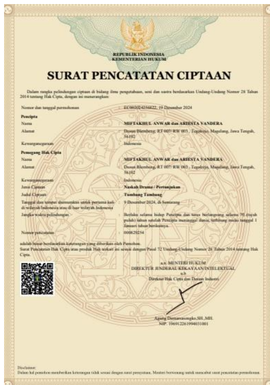
Gambar 3 Hasil Pendampingan Pendaftaran Hak Cipta Naskah “Tumbang Tumbang” pada Direktorat Jenderal Kekayaan Intelektual

Adanya pendampingan pendaftaran hak cipta untuk naskah teater yang telah dibuat oleh komunitas seni (UKM Teater) bertujuan untuk memberikan kepastian hukum bagi pencipta. Meskipun bersifat kolektif, hak cipta tetap berlaku sesuai dengan Pasal 33 ayat (1) Undang-Undang hak cipta yang berbunyi, “dalam hal ciptaan terdiri atas beberapa bagian tersendiri yang diciptakan oleh 2 (dua) orang atau lebih, yang dianggap sebagai pencipta yaitu orang yang memimpin dan mengawasi penyelesaian seluruh ciptaan.” Dengan demikian, setiap pihak yang andil dalam naskah akan mendapatkan hak cipta atas bagian ciptaan yang dikerjakan tanpa mengurangi hak cipta satu sama lain.