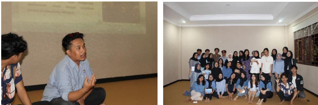
Gambar 1 Dokumentasi Kegiatan Sosialisasi di Arus Balik Coffee & Space

Dengan memahami dan menerapkan prinsip-prinsip perlindungan hak cipta, penulis naskah teater dapat merasa lebih aman dalam berkarya dan termotivasi untuk menciptakan lebih banyak karya berkualitas. Selain itu, edukasi ini juga berkontribusi dalam menciptakan ekosistem seni yang adil dan menghargai orisinalitas, sejalan dengan tujuan Undang-Undang Hak Cipta untuk meningkatkan kecerdasan kehidupan bangsa dan mendorong pertumbuhan industri kreatif di Indonesia.