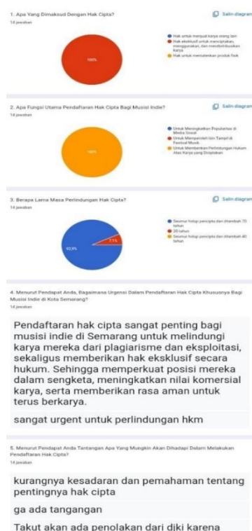
Gambar 2 Data Post-test

Setelah penyampaian materi, Post-test diadakan dan diikuti oleh 14 peserta. Tujuan dari Post-test ini adalah untuk mengukur sejauh mana pengetahuan dan pemahaman audiens tentang hak cipta setelah sosialisasi. Post-test ini juga berfungsi sebagai bahan evaluasi bagi panitia dan pemateri untuk menilai apakah tujuan sosialisasi hak cipta telah tercapai. Dengan membandingkan hasil Post-test dan Pretest, kita dapat melihat perkembangan dan perubahan dalam pemahaman peserta mengenai hak cipta. Berikut hasil dari Post-test: