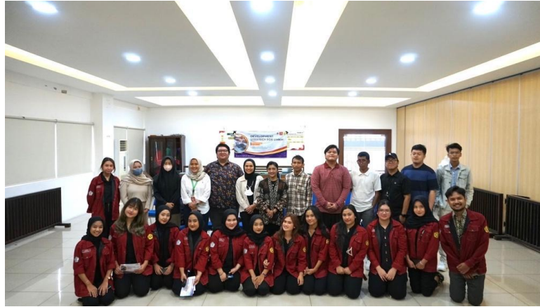
Gambar 7. Dokumentasi Panitia Penyuluhan