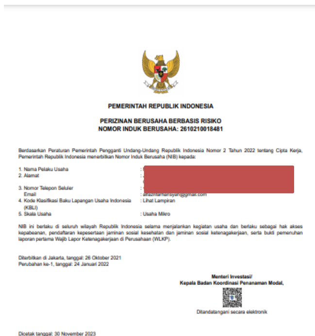
Gambar 2. Bukti Pendaftaran Perizinan Usaha UMKM Es Tebu Bang Fajri