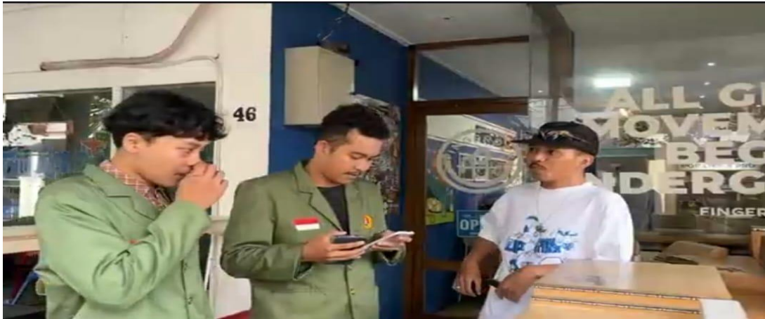
Gambar 2 Melakukan Kegiatan Wawancara dengan Pemilik UKM

Penyuluhan dilaksanakan pada hari Senin, 01 Desember 2025, bertempat di selasar rumput Fakultas Hukum Universitas Pembangunan Nasional “Veteran” Jakarta dan dihadiri oleh para peserta. Sebelum sesi penyuluhan dimulai, tim pengabdian terlebih dahulu memberikan beberapa pertanyaan pretest untuk mengukur tingkat pemahaman awal peserta mengenai konsep merek. Setelah kegiatan penyuluhan berlangsung, pertanyaan yang sama kembali diberikan sebagai post-test guna menilai adanya peningkatan pemahaman peserta terkait materi yang telah disampaikan.