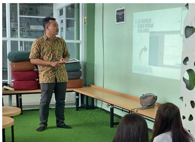
Gambar 4 Tanya Jawab Seputar Pendaftaran Merek