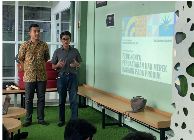
Gambar 5 Dokumentasi Peserta Penyuluhan