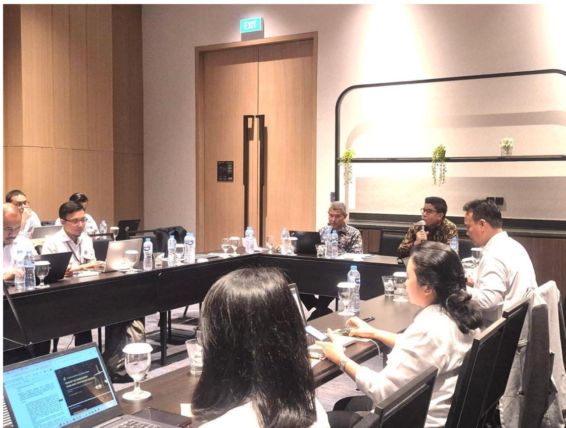
Gambar 2 Proses Pendampingan

Dalam konteks perubahan perilaku organisasi, kegiatan ini memberikan kontribusi dalam meningkatkan sikap proaktif aparatur terhadap upaya pencegahan risiko hukum. Peserta menunjukkan peningkatan pemahaman mengenai pentingnya analisis risiko dalam setiap kebijakan yang diambil, terutama dalam kaitannya dengan potensi pelanggaran hukum dan dampaknya terhadap pelayanan publik. Pembahasan juga menunjukkan bahwa pendekatan berbasis risiko membantu aparatur dalam memprioritaskan area yang memerlukan perhatian khusus. Hal ini mencerminkan adanya pergeseran dari pendekatan reaktif menuju pendekatan