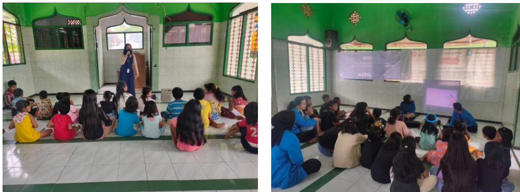
Gambar 3 Kegiatan Perkumpulan Rumah Belajar MiFasol

Dengan melakukan pendampingan pendirian badan hukum perkumpulan, Rumah Belajar Mifasol memperoleh legitimasi hukum yang memberikan kepastian dalam menjalankan kegiatan dan program sosial mereka. Pembentukan badan hukum perkumpulan Rumah Belajar Mifasol memberikan peluang mengenai keberlanjutan program yang lebih baik dan memastikan bahwa misi mereka untuk meningkatkan akses pendidikan bagi anak-anak kurang mampu dapat terus berjalan di masa depan, selain itu Rumah Belajar Mifasol dapat mengakses berbagai sumber pendanaan, termasuk dukungan dari pemerintah, yayasan, dan donatur pribadi.