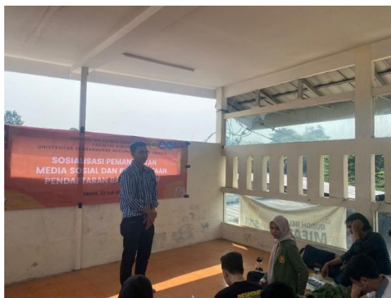
Gambar 1 Paparan Materi Narasumber

Kegiatan yang dihadiri oleh 15 (lima belas) peserta tersebut dilanjutkan dengan diskusi. Diskusi dilakukan oleh tim Dosen dan Mahasiswa FH UPN Veteran Jakarta seputar tentang badan hukum Perkumpulan.