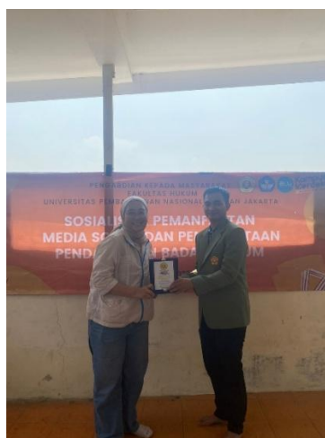
Gambar 5 Kegiatan Penyerahan Cendera Mata ke Pengurus Rumah Mifasol

Pendampingan dalam pendirian badan hukum perkumpulan Rumah Belajar Mifasol adalah langkah penting untuk memastikan proses pendirian berjalan dengan baik dan memenuhi persyaratan hukum dan administratif yang berlaku. Dengan adanya badan hukum perkumpulan, Rumah Belajar Mifasol memperoleh legitimasi hukum yang memberikan kepastian dan keberlanjutan program pendidikan mereka. Selain itu, pendampingan juga membantu Rumah Belajar Mifasol untuk mengakses berbagai sumber pendanaan guna mendukung misi mereka dalam meningkatkan akses pendidikan bagi anak-anak kurang mampu. Pendampingan ini menjadi kunci dalam membantu Rumah Belajar Mifasol untuk berkontribusi positif bagi masyarakat melalui badan hukum perkumpulan yang sah dan berdaya guna.