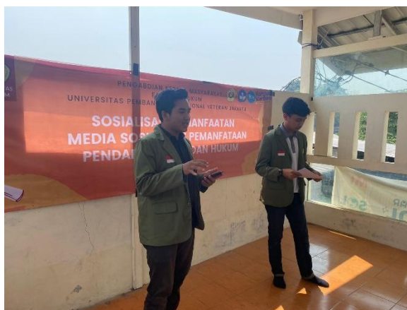
Gambar 2 Tim Pengabdian dari Mahasiswa Memandu Diskusi

Kegiatan yang dihadiri oleh 15 (lima belas) peserta tersebut dilanjutkan dengan diskusi. Diskusi dilakukan oleh tim Dosen dan Mahasiswa FH UPN Veteran Jakarta seputar tentang badan hukum Perkumpulan.